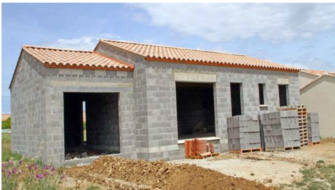
Image 1 : Construction de logements sociaux au quartier Evêché de Daloa